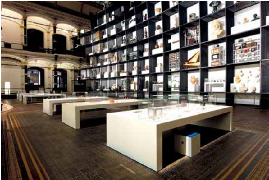
Abb. 3: Inszenierung einer Objektbibliothek im Zentrum der Ausstellung »WeltWissen« (2010).

Auch die Berliner Jubiläumsausstellung »WeltWissen. 300 Jahre Wissenschaften in Berlin« adressierte diese Thematik. Eine objektbasierte Installation im Lichthof des Martin-Gropius-Baus als einer von drei Ausstellungsteilen bildete zehn Jahre nach der Ausstellung »Theatrum Naturae et Artis« am gleichen Ort gleichsam ein Kondensat von deren Objekttheater. In einem Großregal versammelte der Künstler Mark Dion Objekte aus unterschiedlichen Berliner Sammlungen, um sie in ein fiktives, im Wissenschaftszusammenhang nicht existierendes Ordnungssystem zu bringen. Zur Gesamtinstallation gehörten ferner Tische vor dem Regal, auf denen Objekte aktueller Forschung platziert waren (Abb. 3). 26 Das Raumbild suggerierte die Situation einer Objektbibliothek, in der Objekte aus dem Regal entnommen werden können, um sie am Tisch zu be-