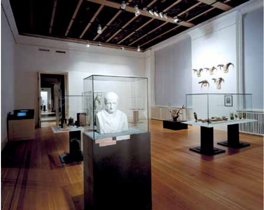
Abb. 2: Die ruhige Präsentationsform der Ausstellung »Theatrum Naturae et Artis« (2000) hob den Schauwert der Objekte hervor. [Installation shot Theatrum].

sitärer Sammlungen nicht hervorgehoben wurden. Die Bezugnahme auf einen gemeinsamen Ursprung in der Kunstkammer und die Schaffung eines Gesamtbildes heterogener Objekte verstellte mitunter den Blick auf die Heterogenität der unterschiedlichen fachlichen und zeitlich veränderlichen Praktiken im Umgang mit den Objekten. Die Frage blieb offen, wie sich die Kunstkammer als barockes Sammelmodell in eine Gegenwart überführen lässt, in der Sammlungen zwischenzeitlich eine mehrere Jahrhunderte währende fachspezifische Ausprägung erfahren haben.